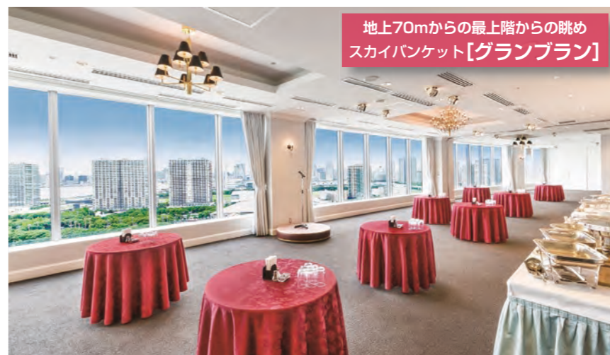
地上70mからの最上階からの眺め スカイバンケット【グランプラン】

東京ベイ有明ワシントンホテルでは、30名から500名まで集まれるバンケットホールをご用意しております。自然光が差し込む心地よい空間で価値ある時間をお過ごしください。