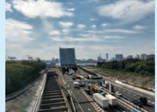
東京港トンネルは、日本の物流を支える動脈。出入り口の上にあるのが通気口です