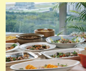
※イメージ ※季節により料理内容は変動します。

※別途室料・音響照明料が発生します。お部屋により料金が異なりますので詳細はお問合せください。