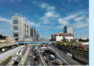
臨海副都心を貫く首都高湾岸線と国道357号線。左にフジテレビ本社屋が見えます