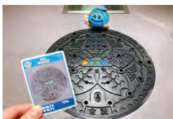
ぜひマンホールカードも!