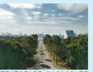
潮風公園の噴水広場。並木の向こうに東京港の海が見えます