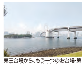
第三台場から、もう一つのお台場・第六台場(立ち入り禁止)が見えます

お台場の名前の由来となった「台場」は、江戸時代末期の黒船襲来に備えて作られた砲台跡で、現在、都立台場公園(第三台場)として整備されています。園内には、陣屋跡、弾薬庫跡など往時を忍ばせる物が残されています。台場を囲むように道があり、東京湾岸の景色が楽しめ、散策におすすめです。 ※多くの人が利用する公園です。マナーを守って静かな散策をお願いします。 最寄駅:ゆりかもめ お台場海滨公園駅から徒歩約10分