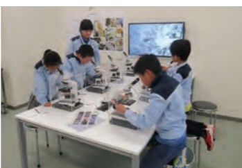
お仕事体験プログラム