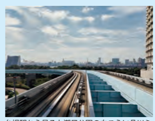
台場駅から見ると潮風公園の向こうに品川ふ頭の様子が見えます

ゆりかもめでは、お台場・有明エリア8駅限定で一日何回でも利用できるお得な乗車券「お台場・有明快遊パス」を、ワンコイン500円で発売中です。「新橋駅」「豊洲駅」事務室の他、お台場海浜公園駅から有明テニスの森駅までの8駅の自動券売機でも購入できます。ぜひご利用ください。