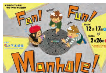
マンホールについて楽しく学ぶ企画展!

また、「誰でも工作」では新年にぴったりの絵馬づくり、「親子で学ぼう!虹のお楽しみキット」ではデザインマンホールエコバッグづくりを実施予定です。各種イベントの詳細はホームページで随時更新します。