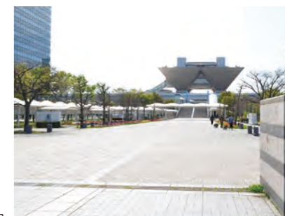
臨海副都心・有明