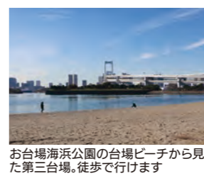
お台場海滨公園の台場ビーチから見た第三台場。徒歩で行けます