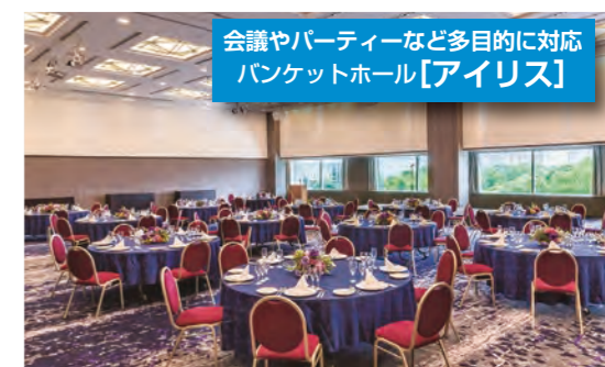
会議やパーティーなど多目的に対応 バンケットホール【アイリス】

展示会や法人企業の株主総会、国際会議、学会、招待会、表彰式典等の会場として最大500名の収容人数まで対応可能。室内は高さが5mあり、最大3分割でご利用いただけるので用途に応じ機能的に使い分けができます。収容人数:30~500名